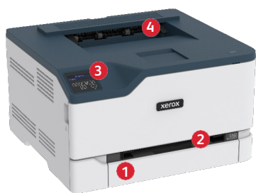
Imprimanta color Xerox® C230