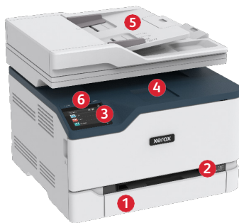
Imprimanta multifuncțională color Xerox® C235