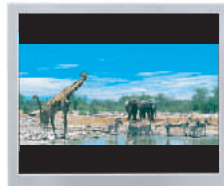
ecran convențional 4:3