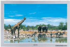
ecran lat 16:9