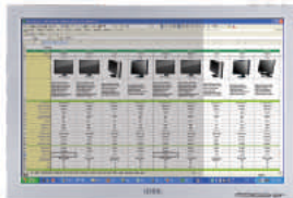
Puteți vizualiza mai multe coloane în același timp