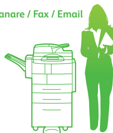
WorkCentre 4260XF cu dispozitiv de finisare și dispozitiv de alimentare de mare capacitate