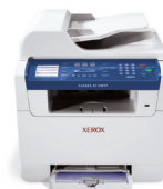
imprimare | copiere | scanare | fax