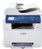
imprimare | copiere | scanare