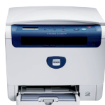
imprimare | copiere | scanare

Pentru mai multe informații vă rugăm să ne contactați la tel. 021 30 33 500 sau să vizitați www.xerox.ro